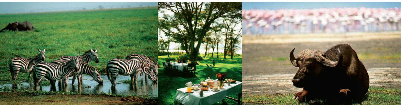
ALLE ESSEN: DIE ZEBRAS IM AMBOSELI-NATIONALPARK (LI.), DIE HIGH-SAFARI-SOCIETY AM LAKE NAIVASHA IM LOLDIA HOUSE (MITTE), UND DER BÜFFEL IM LAKE-NAKURU-NATIONALPARK (RE.) IST SCHON BEIM VERDAUEN.

ALLEIN SCHON DAS AUFWACHEN zwischen den knorrigen Stämmen der Afro-Designer-Betten des „Governors II Moran's Camp“ verspricht sinnliche Mara-Momente. Fettig-weiße Wolkenbänke, dazwischen blassrosa Streifen – wie zart durchzogener Antilopenseck sieht die Morgendämmerung am Horizont der Steppe aus. Dazu kommt jetzt, so gegen halb sechs, auch noch der saftige Geruch von frischen Gräsern, ein erdiges Aroma von Adventure, Adrenalin und Afrika. Black Label eben, hochprozentig. Wir befinden uns im Herzen des berühmten Nationalparks, der unmittelbar an die